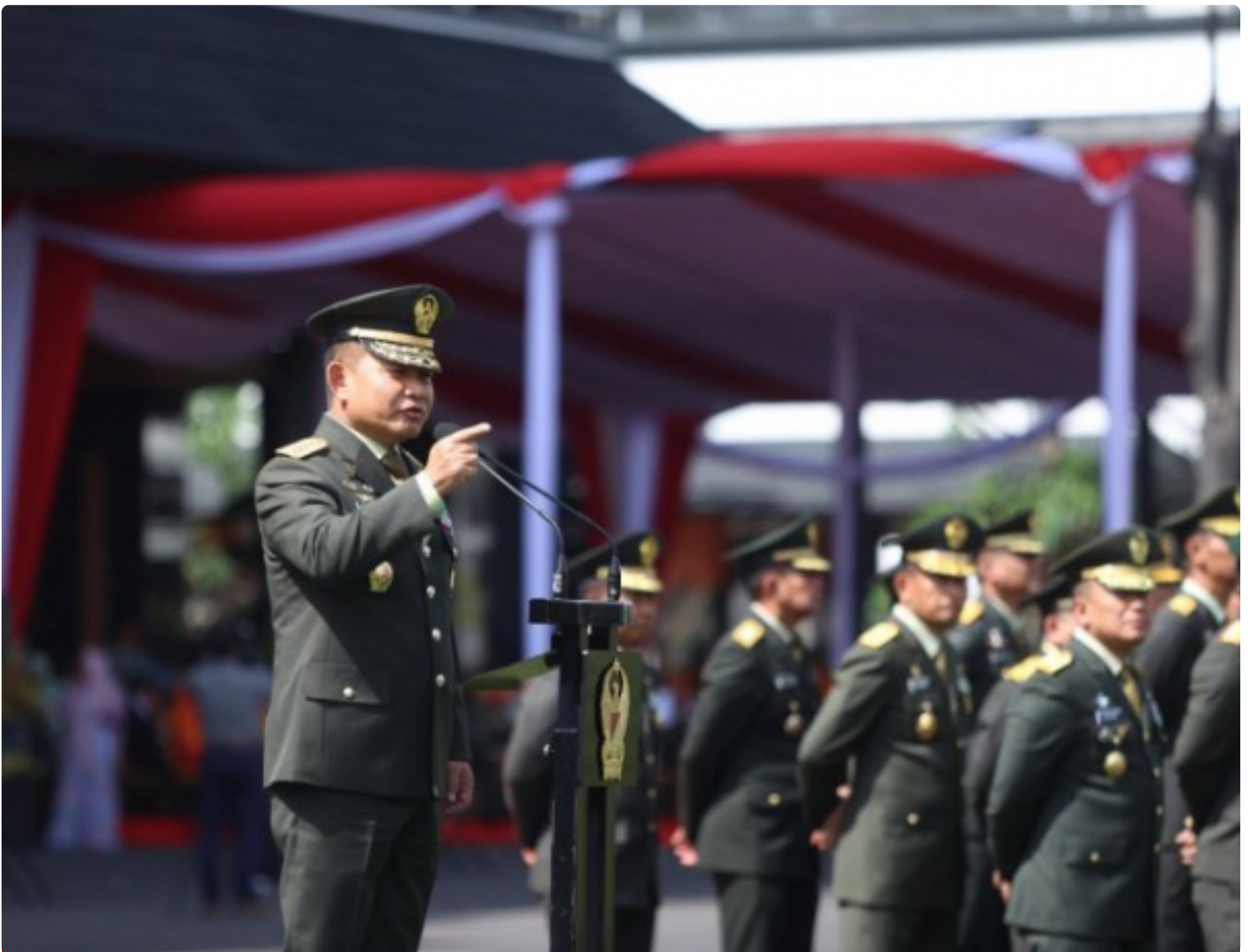
Kepala Staf Angkatan Darat (Kasad) Jenderal TNI Dr. Dudung Abdurachman saat menyampaikan pesan kepada 292 Perwira Remaja (Paja) TNI AD Lulusan Akademi Militer Tahun 2022 di Mabesad, Jakarta

Jakarta – "Ingat Prajurit kita saat ini bukanlah obyek lagi, tetapi telah menjadi subyek. Kalau kamu memimpin tidak benar maka dia akan bergejolak dan kamu akan berhenti. Oleh karena itu lakukan yang terbaik dengan berpegang teguh kepada Sapta Marga, Sumpah Prajurit dan 8 Wajib TNI serta 11 azas